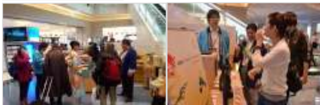
実施中のキャンペーン風景

また、「日本の酒(日本酒・焼酎)」の専用コーナーを同店内に設置し、販売しております。